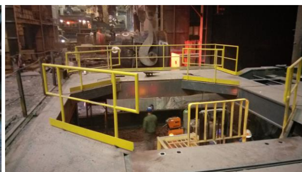
Fotodokumentace průběhu výstavby

Trinecký inženýring, a.s. Nad Tyrkou 101 739 61 Třinec-Staré Město